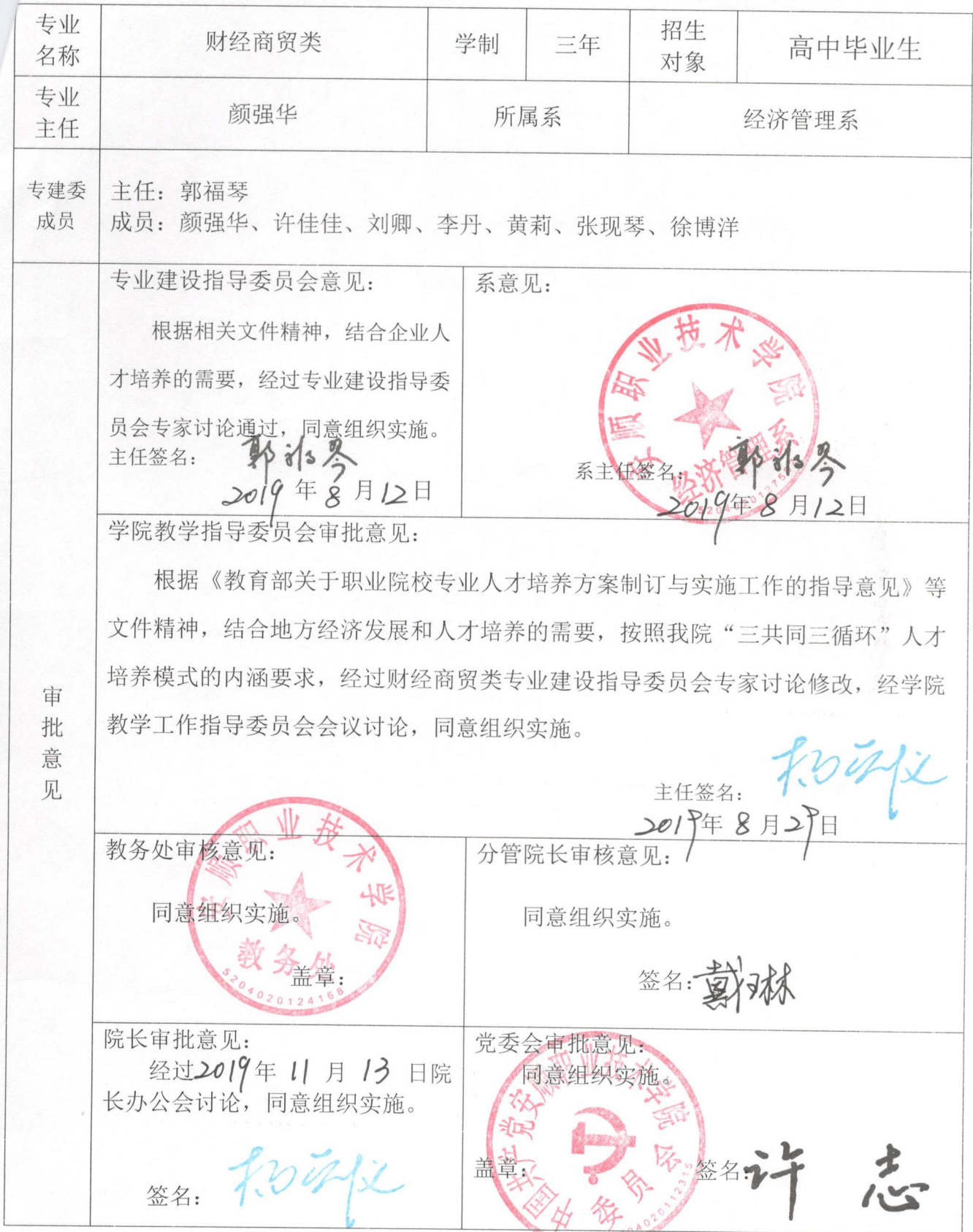
安顺职业技术学院人才培养方案审批表